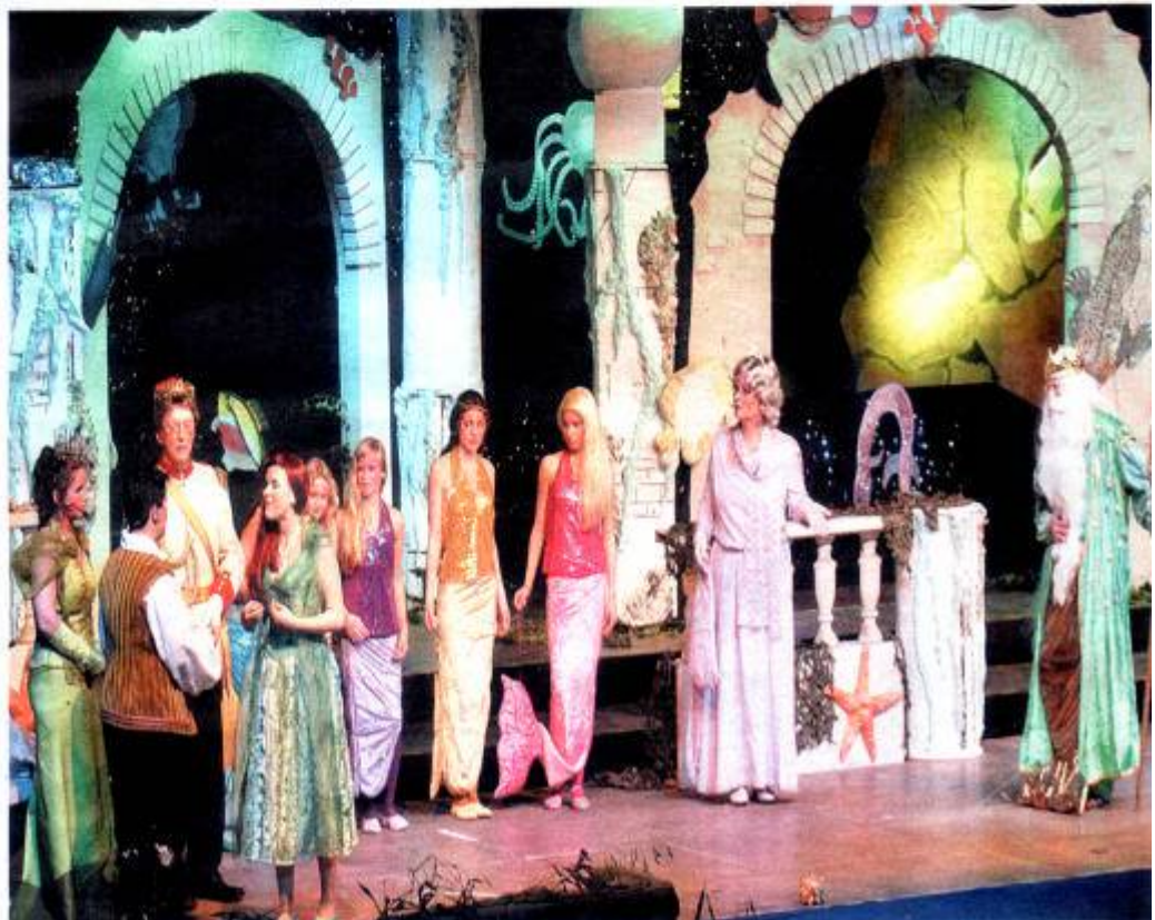
Happy End: Der Zauber der Meerhexe ist besiegt und Leana und Prinz Dominik finden in der Unterwasserwelt zueinander.