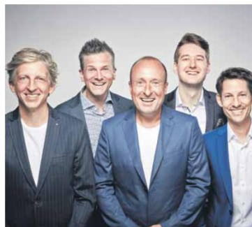
Die A-Cappella-Gruppe „basta“ rufen ihre Fans zur Mit-Gestaltung ihres Abschiedskonzertes in Straelen auf.

Als „basta“ vor mehr als 20 Jahren mit Kneipkonzerten vor Freunden und Freunden von Freunden begann, rechnete niemand damit, dass aus den Vokal-Enthusiasten von einst eine der bekanntesten A-cappella-Bands Deutschlands werden würde. Und eine der beliebtesten. Basta schafft es jeden Konzertabend erneut, die großen Fragen des Lebens in unterhaltsame, musikalische Preziosen zu fassen und begeistert damit ihr junges wie altes Publikum. Seit mehr als zwei Dekaden und mittlerweile neun Alben. „Eure liebsten Lieder“ heißt die aktuelle A-Cappella-Show; und der Name ist Programm: Denn seit so langer Zeit versorgen die fünf